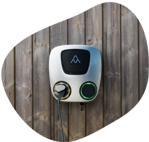
Ladestasjon Type 2

Lading på vanlig stikkontakt (shuko) brukes kun når nødlader må benyttes, da det ikke er noen kommunikasjon mellom bilen og boligens strømmnett, foruten bilens ombordlader/nødlader. Ladestrømmen er også lav (maks. 8-10A) noe som resulterer i mindre effektiv og lengre lading.