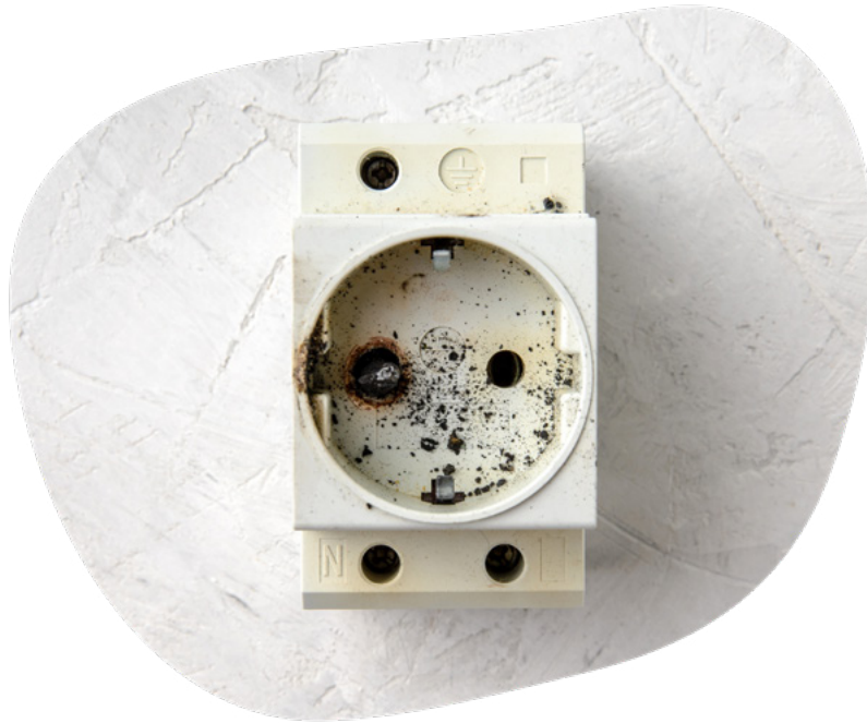
Lading på eksisterende stikkontakt kan føre til varmgang og brann.

Hvis en eksisterende stikkontakt i boligen benyttes regelmessig til lading av elbil, vil dette falle under bruksendring etter FEL §16. Denne sier at «anlegget skal være egnet til forutsatt bruk». Selv om en stikkontakt kan belastes med opptil 16A, så er ikke dette en påkjenning den er beregnet for over lengre tid. Koblingspunkter og utstyr vil ta skader av slik bruk, noe som igjen kan føre til varmgang og branntilløp.