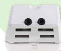
Sensor for tak