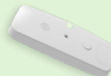
Sensor for vegg