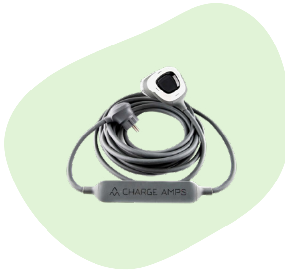
Lader med vanlig stikkontakt (nødlader)