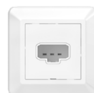
Stikkontakt for lys